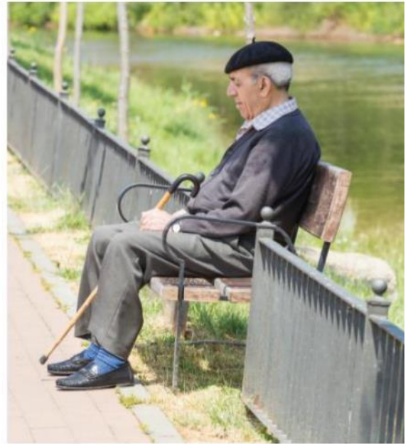
De paseo y echando una siesta

Lo más curioso para el observador acostumbrado a un horario europeo ‘normal’ es que la final de la versión española de ‘MasterChef’ termine a las 00:45. Este horario explica, en parte, por qué se decía de España que era ‘un buen país para vivir pero no para trabajar’. Pero antes de aceptar este nuevo horario, será importante decidir si lo que era ‘diferente’ del país tenía un valor que vale la pena conservar.